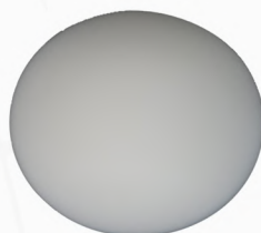
Disco de esponja blanco