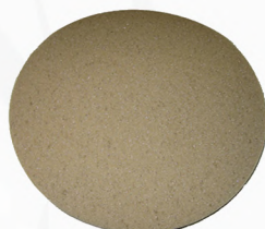
Disco de esponja estándar