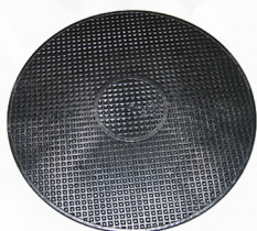
Disco llana para pared rugosa