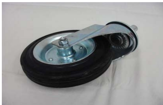
Art. 2040039 RUOTA MM22 D 200/50