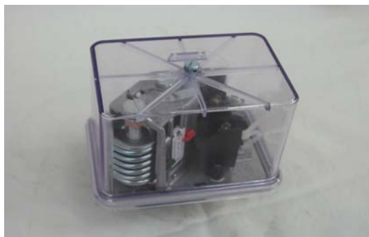
Art. 2040024 PRESSOSTATO FF 4-4 DAH/F5