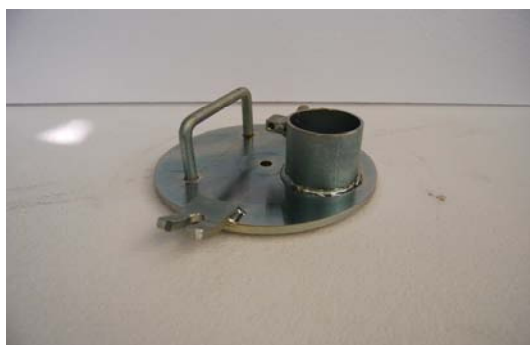
Art.2030206 BOCCA DI SCARICO REAL MIX