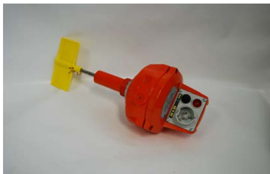
Art. 1020043 SONDA 42 V Art. 1020109 SONDA 24V