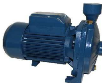
Art. 2030196 ELETROPOMPA CMP 152 220/230/50 HZ