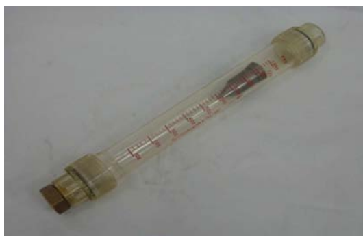
Art. 2140013 FLUSSOMETRO COMPLETO