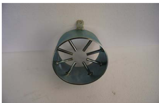
Art. 2040465 ADATTATORE - IMPASTATORE