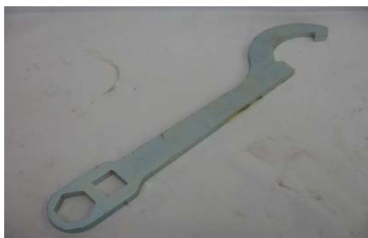
Art.5010081 CHIAVE / C RACC.STORZ 52