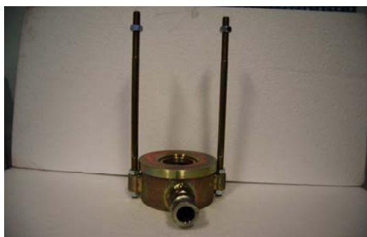
Art. 2040559 ROTOMIX CPL TURBO