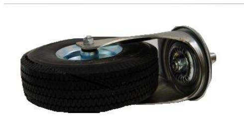
Art.2040610 RUOTA D..260X85 SENZA FRENO SEMIP