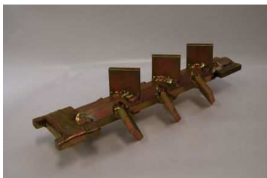
Art. 2040179 MISCELATORE PER MAC BETON