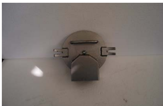
Art.2030206 BOCCA DI SCARICO REAL MIX