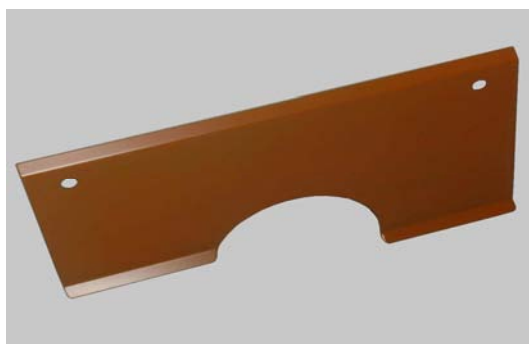
Art. 2050026 PARAPOLVERE