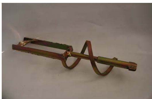
Art. 2040086 MISCELATORE M3