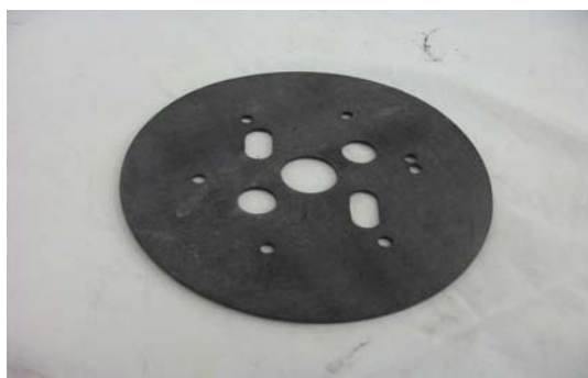
Art. 2040116 MEMBRANA COMPRESSORE HANDY