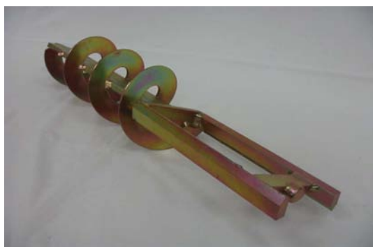
Art. 2040110 MISCELATORE F18/MUS ZINC