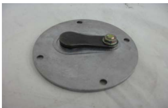
Art. 2030031 PIATTO BIELLA 1 VALVOLA