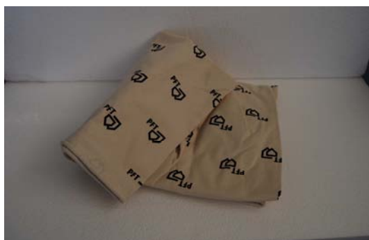
Art.1030014 TELA PER CUFFIA MONOFILTRO