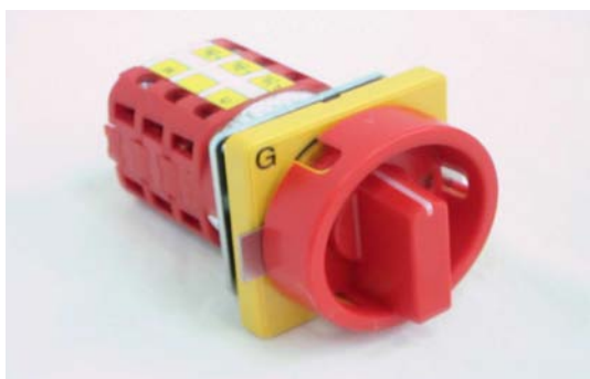
Art. 3010090 COMMUTATORE DI FASE PRINCIPALE PFT