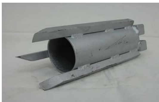
Art. 2140015 PULITORE CAMERA MISCELAZIONE