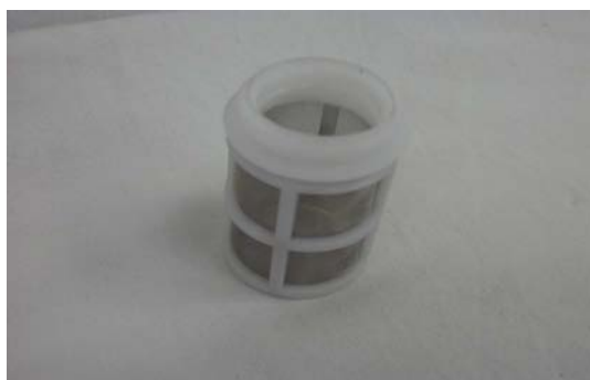
Art. 2040075 FILTRO RIDUTTORE DI PRESSIONE