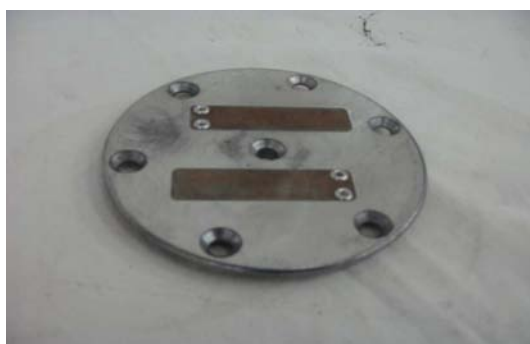
Art. 2040087 MEMBRANA COMPRESSORE SEGOLA