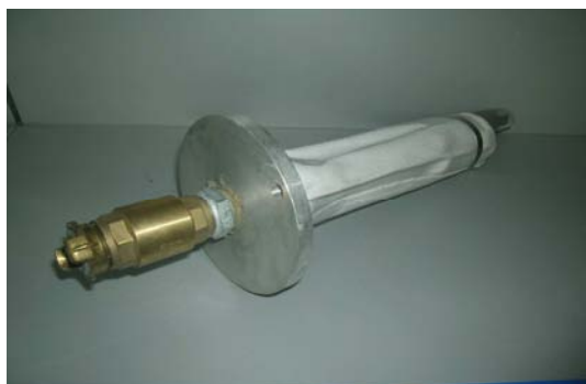
Art.2040109 INIETTORE COMPLETO DI UGELLO E FILTRO