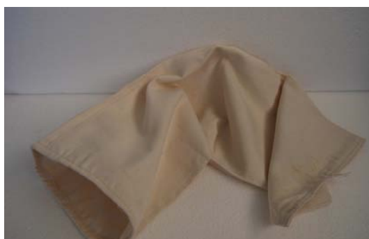
Art.1030013 TELA PER CUFFIA