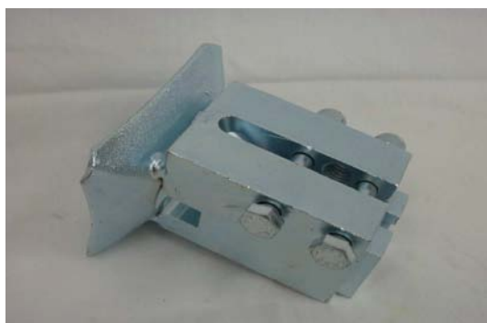
Art. 2040072 SUPPORTO MOTORE