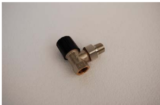
Art. 5010273 VALVOLA FLUSSOMETRO MICROMETRICA