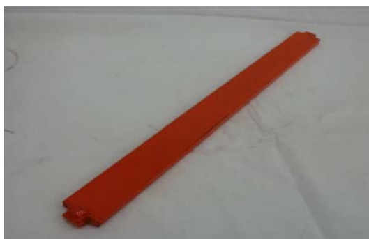
Art. 2040088 ASTA PULITORE CAMERA MISCELAZIONE