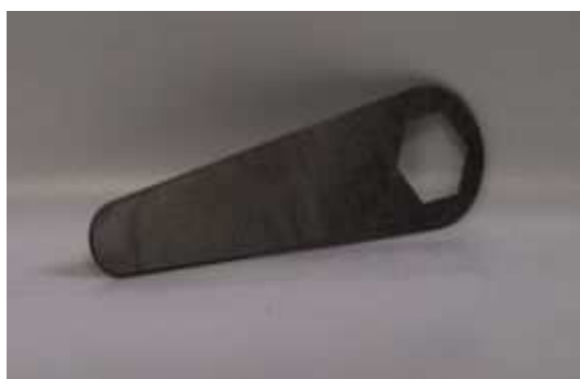
Art. 1020002 CHIAVE MANUTENZIONE D06-D07