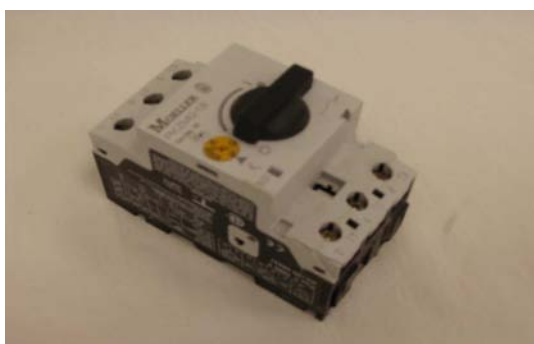
Art. 3010033 PKZMO 16 A