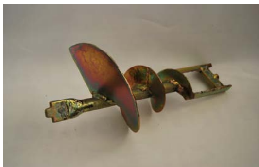
Art. 2040214 MISC. MAC 90/97 Art. 2040607 MISC. MAC JUNIOR PER TERMOISOLANTE