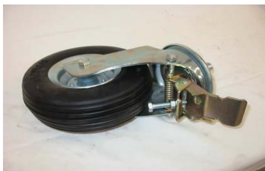
Art. 2040041 RUOTA MAC 97 C/FRENO Art. 2040040 RUOTA MAC 97 S/FRENO