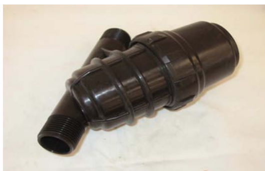
Art. 2040095 FILTRO ACQUA