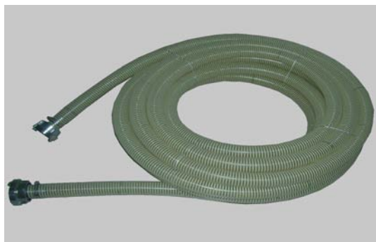
Art.2040198 TUBO MATERIALE COMPLETO