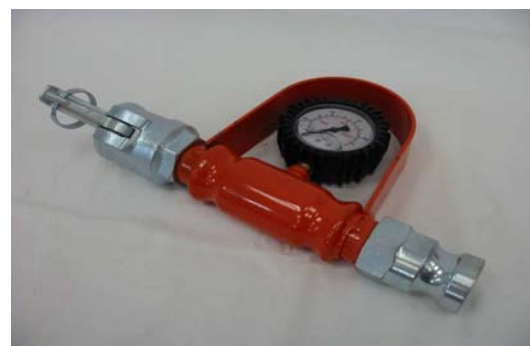
Art. 2150022 MANOMETRO PROVAMATERIALE D.25