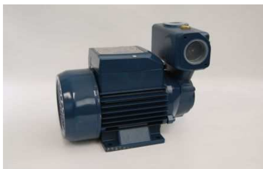
Art. 2030164 ELETROPOMPA PKSM 60 HP 0.5 Art. 2030165 ELETROPOMPA PKS 60 HP 0.5