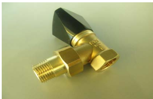
Art. 5010118 VALVOLA FLUSSOMETRO