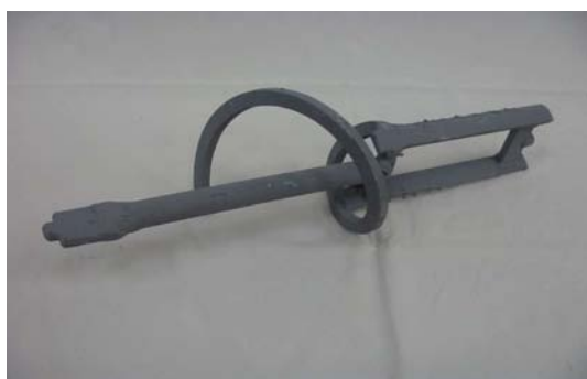
Art. 2040117 MISCELATORE MAC 90 / 97 Art. 2040554 MISCELATORE MAC JUNIOR