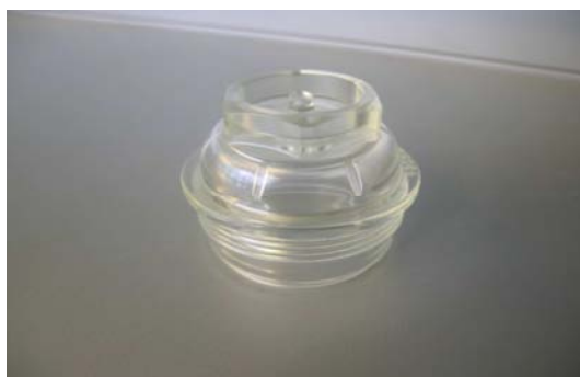
Art. 2040074 BICCHIERE PER RIDUTTORE DI PRESSIONE