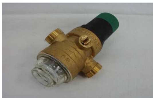
Art. 5010089 RIDUTTORE PRESSIONE 1/2"