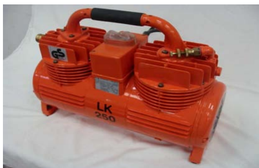
Art. 2030011 COMPRESSORE LK250