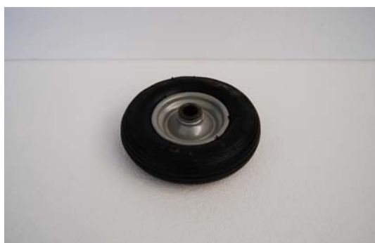
Art.2040461 RUOTA SR.DIA200/50 KS RULLI