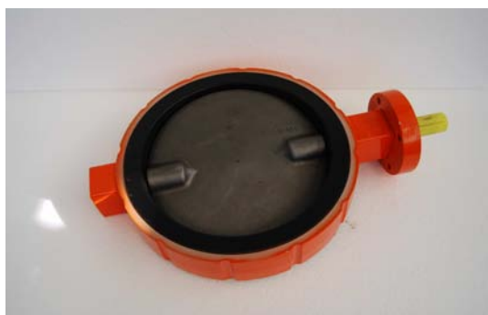
Art.2040097 VALVOLA A FARFALLA PER SILOS