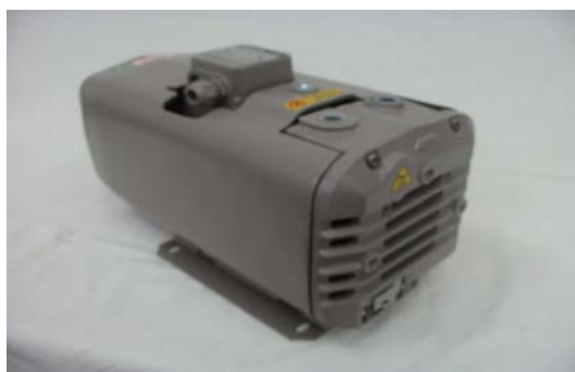
Art. 2030014 COMPRESSORE 16 B M Art. 2030048 COMPRESSORE 16 B T