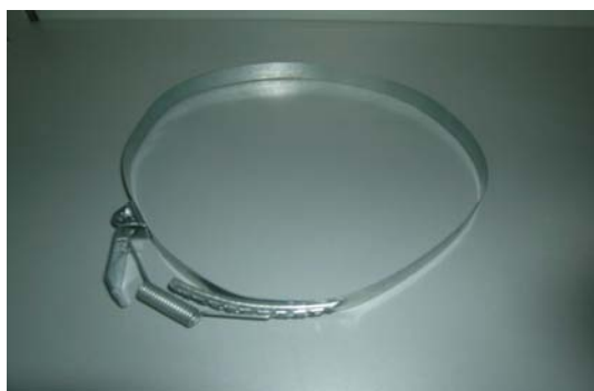
Art. 5010031 FASCETTA A SCATTO DIAM 200