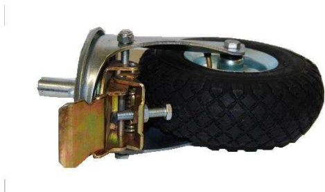
Art.2040609 RUOTA D..260X85 CON FRENO SEMIP