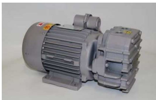
Art. 2030012 COMPRESSORE 12 M/A MONOFASE