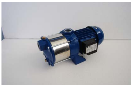
Art.2030217 POMPA COMPACT /A A/6 Art.2030215 POMPA COMPACT /A A/8