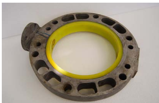
Art.2040484 VALVOLA RIGENERATA PER SILOS