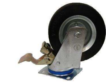
Art. 2040275 RUOTA DIAM 200X70 CON FRENO Art.2040274 RUOTA DIAM. 200X70 SENZA FRENO