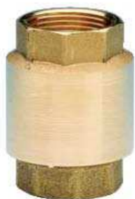
Art. 5010128 VALVOLA DI RITEGNO 3/8" Art. 2040255 VALVOLA EUROPA 3/4" Art. 2040256 VALVOLA EUROPA 1"