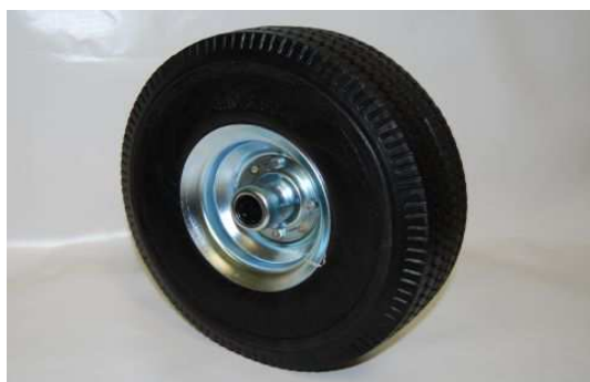
Art. 2040560 RUOTA SR DIAM.260 X85 SEMIPIENA