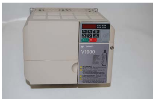
Art.3010133 INVERTER 4 KW 220V MONOFASE