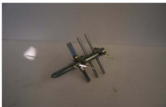
Art.2040563 MESCOLATORE REALMIX