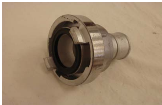
Art. 5010083 RACC. STORZ 52 PTG D 45 Art. 5010082 RACC. STORZ 52 FEMMINA 2"