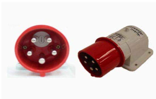
Art. 3020102 INVERTITORE DI FASE 32 A 3 PNT