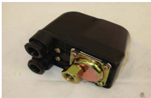
Art. 2030034 PRESSOSTATO TRIF. PT5 5 BAR / CS 01