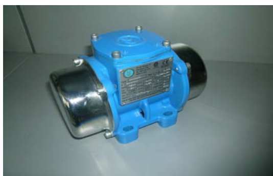
Art. 1020056 VIBRATORE 230 V KW 0.08/1500 220V HZ50 Art. 1020055 VIBRATORE 380.KW 0.08/1500 220/380 HZ50 Art. 1020027 VIBRATORE ELETTRICO VEP 3/380100