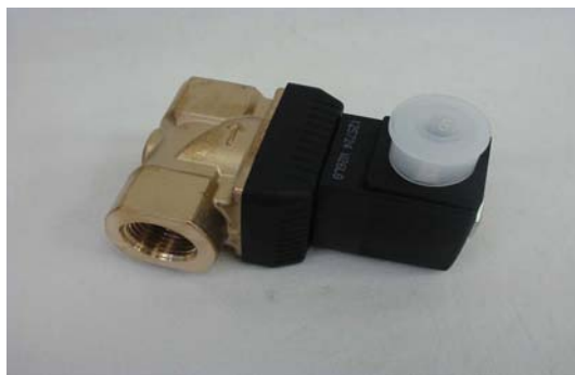
Art. 3020002 ELETTRORVALVOLA 24V Art. 3020132 ELETTRORVALVOLA 42V