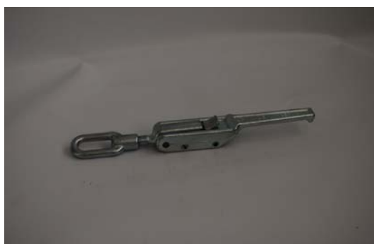
Art. 2040236 GANCIO CHIUSURA CAMERA MISCELAZIONE