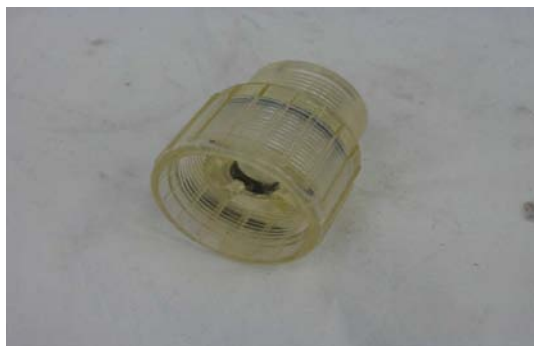
Art. 2040084 BOCCOLA FLUSSOMETRO