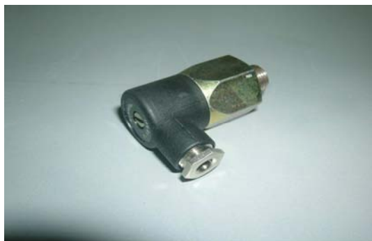
Art. 2040220 PRESSOSTATO CH 1-10 BAR ¼"