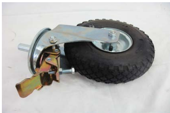
Art. 2040042 RUOTA MAC 90 C/FRENO